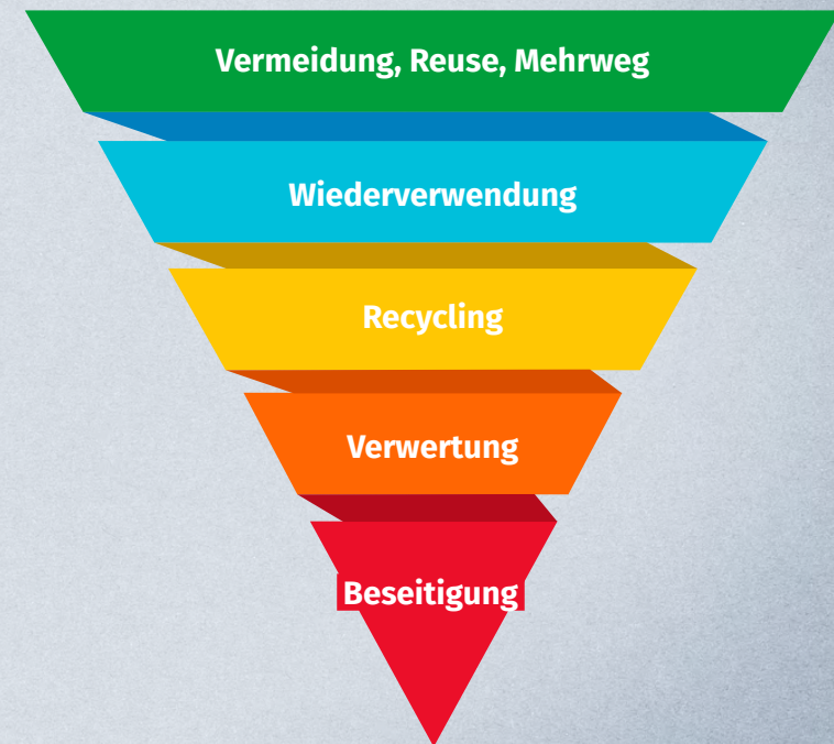
Europäische Abfallpyramide 1 Richtlinie 2008/98/EG

Rede von Steffi Lemke bei der 2. Deutschen Mehrwegkonferenz der Deutschen Umwelthilfe